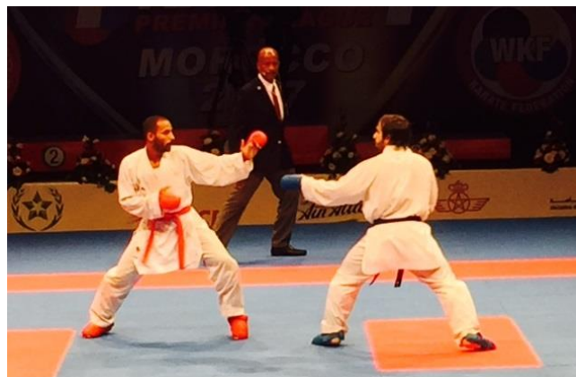
世界チャンピオンのラファエル・アガイエフ選手(右)を始め優秀な選手が多数出場していました。