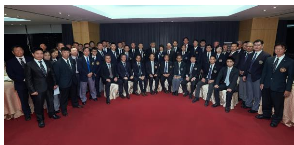
(上: 香港空手道連盟会長と。関係者一同の直筆サインが入った記念品を頂きました 下: EAKF 役員)

の各国の関心は非常に高く、共通目標を持って東アジアが一つになった実感がありました。皆様の期待に応えるべく、引き続き追加種目採用に向けて取り組んでまいります。